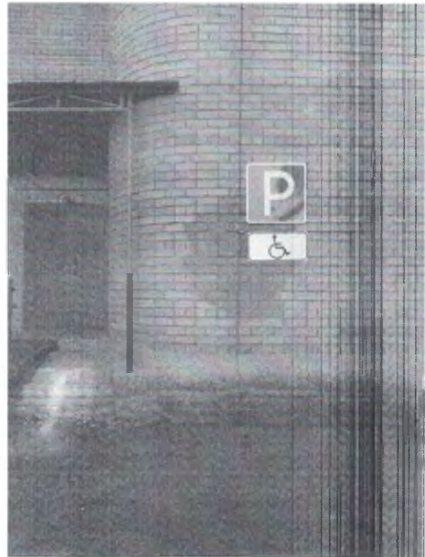
Наличие выделенной стоянки автотранспортных средств Фото № 2