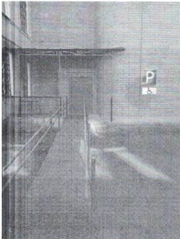
Оборудование входных групп пандусами Фото № 1